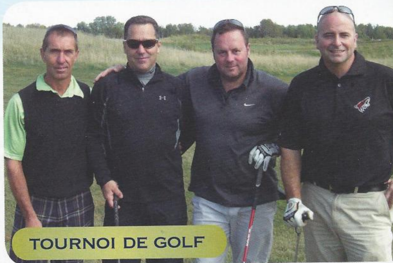
TOURNOI DE GOLF